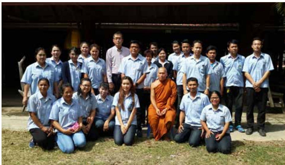
• กิจกรรมทอดผ้าป่า ณ วัดป่าอุดมธรรม วันที่ 11 สิงหาคม 2559