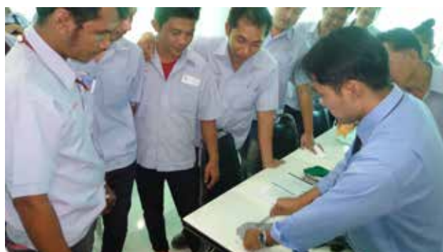
• อบรม จป. หัวหน้างาน