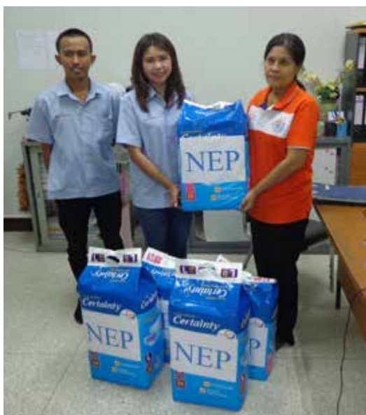
• กิจกรรมร่วมบริจาคของใช้จำเป็นแก่ผู้สูงอายุ อบต. นากลาง จังหวัดนครราชสีมา