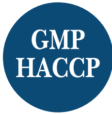
GMP & HACCP Standard