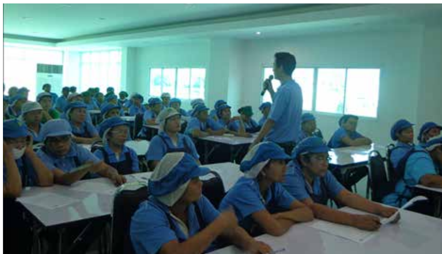
• อบรม ระบบ GMP พนักงาน